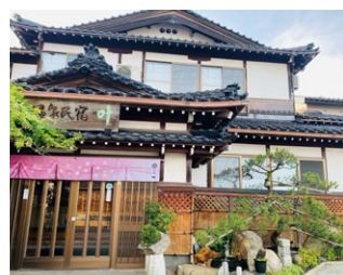
ひみ栄和温泉 元湯 叶