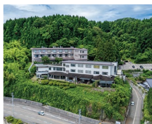
なだら温泉元湯 磯波風